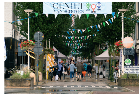
Geniet van Schoten

Een bloeiende economie vlakbij is belangrijk voor werk en welvaart vlak achter de hoek waar je woont. Een Schoten waar ondernemers thuis zijn om welvaart te creëren die de hele gemeente ten goede komt. “De taart moet eerst gebakken worden, voor je ze kan verdelen”, is een uitdrukking die het wellicht nog het duidelijkst maakt.