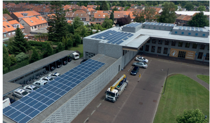
Zonnepanelen op het politiegebouw