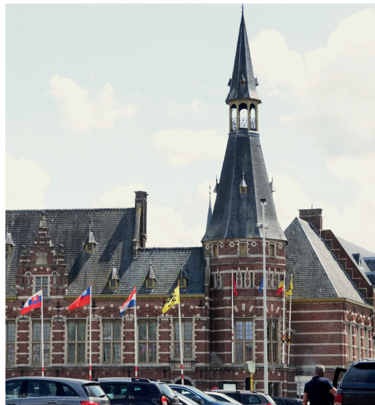
Het gemeentehuis van Schoten

We mogen gerust zeggen dat we in vergelijking tot veel andere gemeenten tot de beste leerlingen van de klas behoren. De laatste 20 jaar gingen de belastingen niet omhoog, ze daalden zelfs lichtjes. De Schotense belastingdruk ligt 10 procent onder het Vlaamse gemiddelde en ook wat de uitstaande schulden betreft, scoren we een derde minder dan het Vlaamse gemiddelde. Conclusie? De rekening klopt!