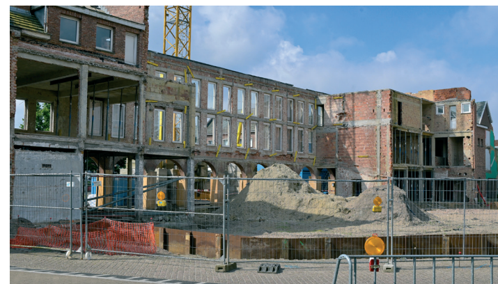
Renovatie van diverse waardevolle Schotense gebouwen