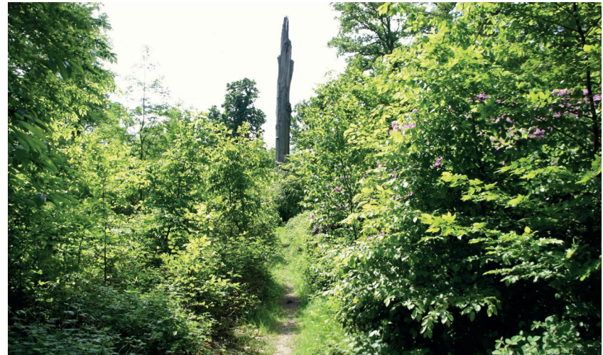
Groen in Schoten

Ook het project Weytschot mag niet in dit rijtje ontbreken want het is een geslaagd huwelijk tussen ecologische, sociale en economische initiatieven. Bioboeren, de bewoners van De Vier Notelaars, natuur en bedrijvigheid krijgen er hun terechte plaats.