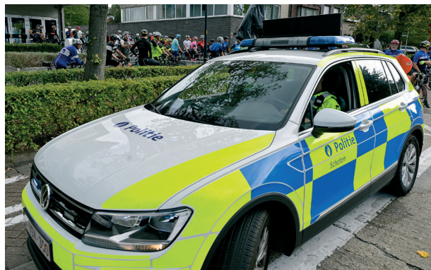
Het gemeentelijk budget voor politie en brandweer werd deze legislatuur opgetrokken