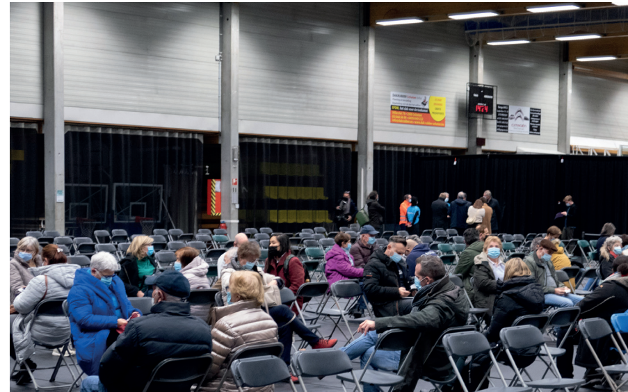
De coronacrisis, een dikke pluim voor de vele vrijwilligers