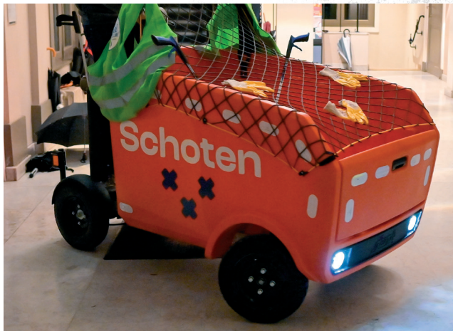
De aankoop van goed materiaal

Wel doen we ons uiterste best om iedere dag opnieuw onze gemeente proper te houden: met extra ploegen, met het plaatsen van extra (hondenpoep) vuilnisbakken, met de aankoop van goed materiaal en met de hulp van de hele bevolking en de vele vrijwilligers van “Mooimakers”. Veel dank daarvoor!