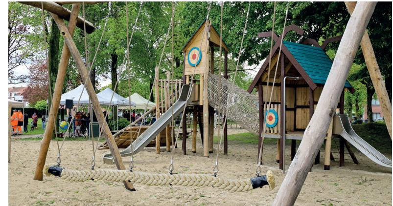
De nieuwe speeltuin in het park vlakbij het Kasteel Van Schoten