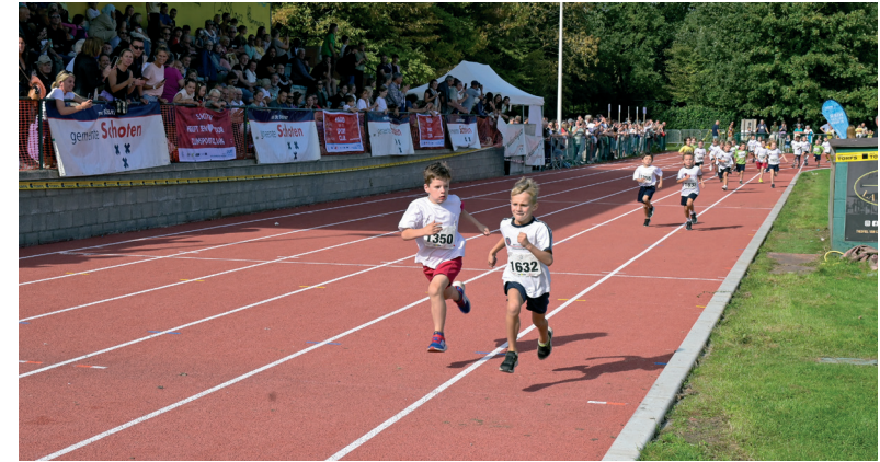
De vernieuwde atletiekpiste

“ In 67 sportclubs doen 9000 Schotenaren aan sport.