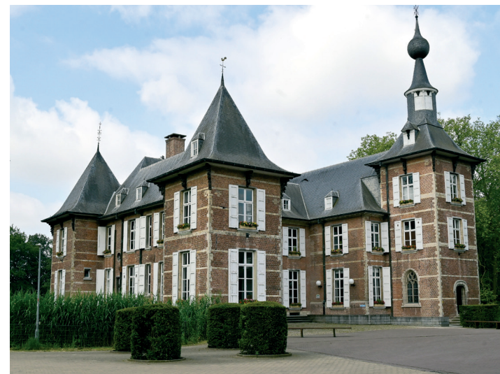
Kasteel van Schoten

De voorbije 6 jaar investeerden we 30 miljoen euro in het verbeteren en renoveren van diverse waardevolle Schotense gebouwen en we zijn van plan dit te blijven doen. Onder andere het Kasteel van Schoten gaan we grondig aanpakken, net als de pastorie aan het Sint-Cordulaplein. Het werk om Schoten nog beter te maken is nooit af.