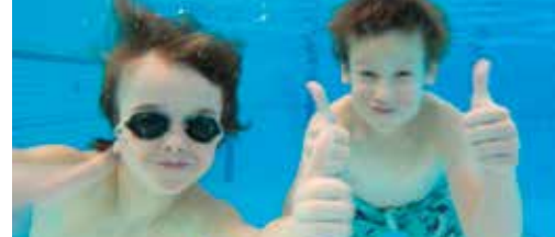
N-VA ondersteunt schoolzwemmen p. 3