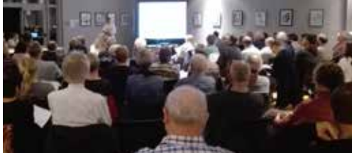
BIN-werking draait op volle toeren p. 2