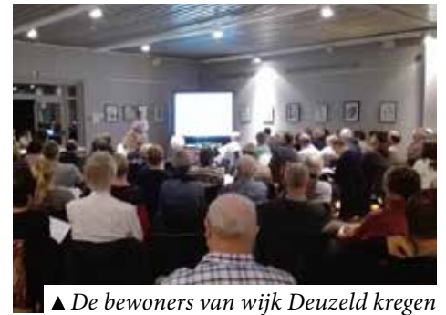
▲ De bewoners van wijk Deuzeld kregen meer uitleg over de basisprincipes van de BIN-werking.

Bewoners werken op vrijwillige basis samen met de BIN-coördinatoren, die in rechtstreeks contact staan met de