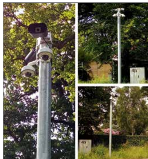
▲ De ANPR-camera's in onze gemeente hebben hun nut al meermaals bewezen.

De ANPR-camera's op de Horstebaan en de Calesberghdreef hebben hun nut al bewezen. Op dit moment worden er camera's geplaatst aan de Brechtsebaan, Botermelkbaan en Toekomstlaan. In een volgende fase komen onder meer de Winkelstap, de Eethuisstraat en de Deuzeldlaan aan de beurt.